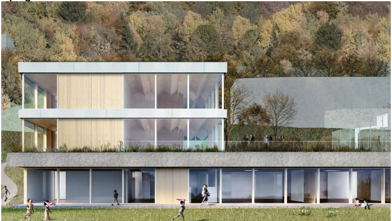
Rendering della vista sud del progetto 561.60 di Charles de Ry Architettura vincitore del concorso

La giuria apprezza l'approccio progettuale e d'inserimento urbanistico nell'area di concorso, che presenta una logica molto precisa. La proposta concettuale si riassume in una chiara e puntuale modifica orografica del terreno, con il collegamento tra la strada cantonale ed il sedime di progetto alla quota 561.60 mslm. La creazione di una nuova terrazza panoramica non costituisce solamente una piazza per la scuola, ma anche uno spazio d'incontro pubblico per gli abitanti, nonché per le manifestazioni e le feste del paese. All'interno di questo gesto progettuale, sono inserite le attività della Scuola dell'Infanzia su un unico livello, mentre un volume puntuale, a pianta quadrata e su due livelli, definisce gli spazi della Scuola Elementare.