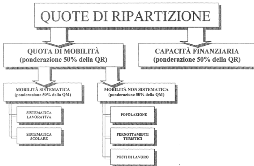
Figura 2 Costruzione della chiave di ripartizione intercomunale PTL

Il meccanismo prevede l'aggiornamento costante della chiave di riparto, a scadenze triennali, in funzione dell'evoluzione dei parametri statistici utilizzati per il calcolo.